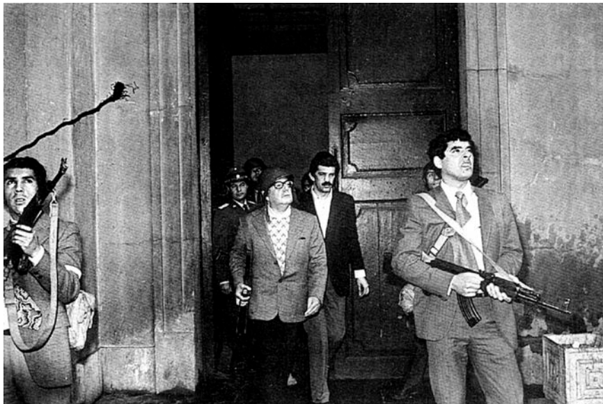
Salvador Allende en el Palacio de la Moneda, 11 de septiembre de 1973